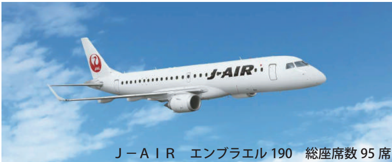
J-AIR エンブラエル190 総座席数95席

※お電話でのお受付後、ツアーお手続きに必要な書類一式(ツアー申込書、前泊ホテルのご案内等、旅行条件書)、お申込金お支払い方法を書面にてご案内させていただきます。お申込書につきましては弊社へご返信をお願いします。